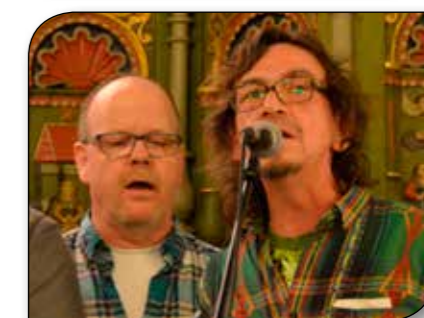
En koncert med Fangekoret den 17. januar, der gjorde et stort indtryk.