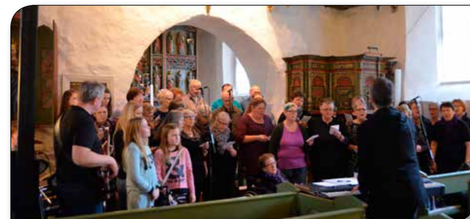
Gospeldag den 22. februar.