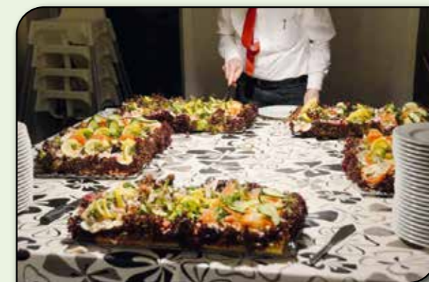
Efter anstrengelserne var der pålægslagkage til kor og blæsere.