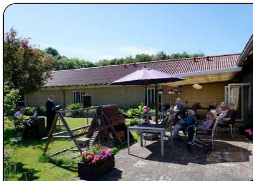
Friluftsgudstjeneste på Solgården

"For syndens løn er død, men Guds nådegave er evigt liv i Kristus Jesus, vor Herre." Paulus brev til romerne 6,23