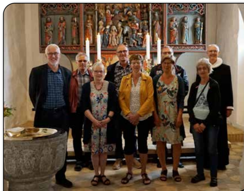
Årets guldkonfirmander – samlet den 28. juni.